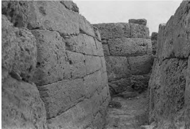
FIGURA 7. Negatiu escanejat de les tombes fundacionals de Son Real. Arxiu Tarradell.

introducció en la qual explicava les circumstàncies del descobriment i excavació de la necròpolis, la seva localització i els treballs portats a terme. L'estudi dels materials i de les necròpolis, pel que fa als aspectes més socials i històrics, va restar, però, en estat incipient.