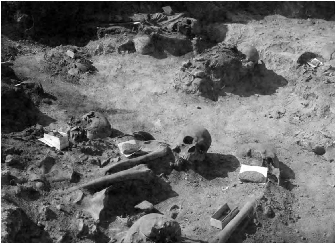
FIGURA 9. Excavació de la necròpolis de l'illa dels Porros, inhumacions del cercle C.