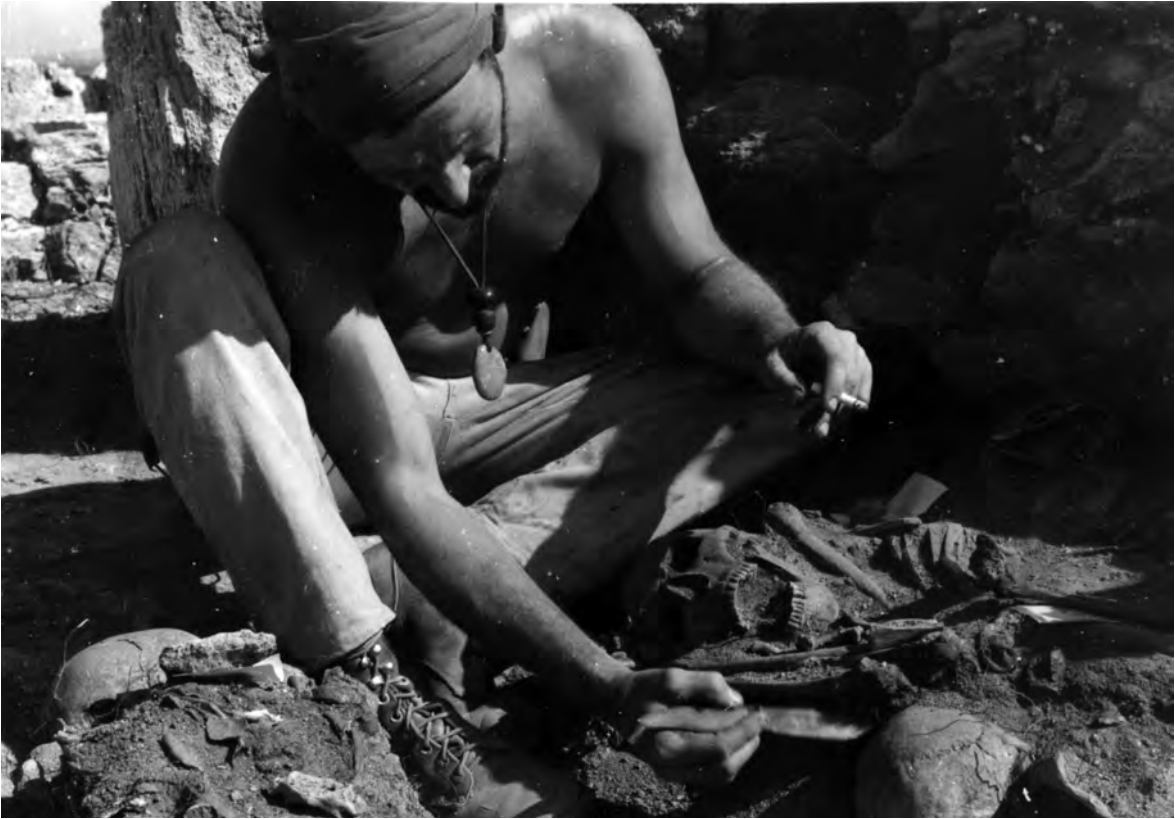
FIGURA 5. William H. Waldren, el polièdric artista i arqueòleg de Nova York, que tant va influir en la prehistòria balear a les dècades dels anys vuitanta i noranta, excavant a l'illot dels Porros.

d'excavar-lo parcialment. Aquesta preocupació, expressada a la introducció inèdita de la publicació de la projectada monografia del jaciment i en converses molt posteriors amb qui signa aquestes línies, es va traduir en la consolidació reiterada de les sepultures. Es va usar ciment mallorquí per fixar els blocs i lloses de les estructures més dèbils, les filades superiors i les restes de cobertes, a fi d'assegurar l'estabilitat mecànica de cada monument. Com d'efectives van ser aquestes operacions, repassades any rere any mentre van durar les intervencions, es va posar de manifest amb el pas del temps, ja que sens dubte gràcies a la consolidació dels anys seixanta s'han conservat moltes de les sepultures, que tot i així van patir un fort deteriorament durant les tres dècades posteriors.