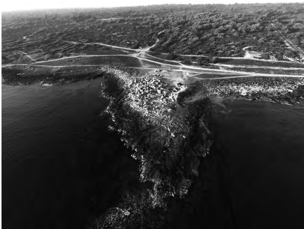
FIGURA 12. Punta dels Fenicis i, al fons, pinar de Son Real a l'agost de 2016.

Respecte a la recerca de Son Real a principis dels anys seixanta escrivia, «Mientras se desarrollaba la primera campaña nos preocupó el problema del poblado. Evidentemente, a la larga, interesará mucho poder completar la visión que hoy tenemos de la comunidad que enterró sus muertos en Son Real con el conocimiento y excavación del poblado» (Tarradell, 1964, 4).