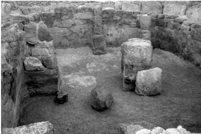
FIGURA 10. Interior de la cambra funerària C de l'illa dels Porros a l'estiu de 1997, després de la consolidació.

Després d'una breu interrupció, aquesta vegada causada per l'anul·lació de la convocatòria de subvencions d'arqueologia a l'illa de Mallorca, que va suposar que l'any 2011 no s'hi actués, es van reprendre les intervencions l'any 2012 amb un equip directiu molt semblant a l'anterior. Aleshores va ser de nou l'Ajuntament de Santa Margalida qui prestà el seu suport finançant en solitari les campanyes fins a