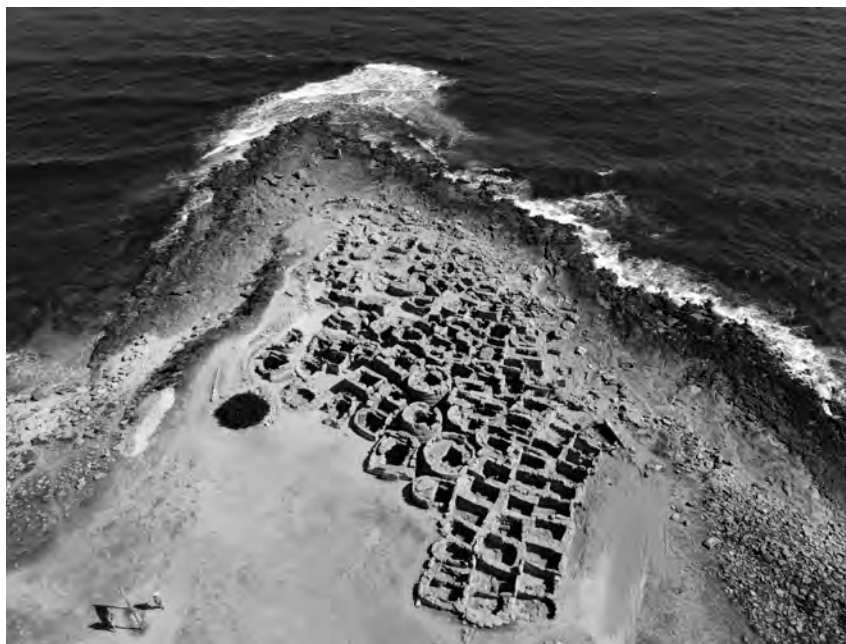
FIGURA 11. Imatge de la necròpolis de Son Real l'agost del 2019.

l'any 2021, llevat d'una intervenció que va comptar també amb cofinançament per part de la Direcció Insular de Patrimoni Històric. Totes les intervencions fins a l'any 2017 han estat publicades a la sèrie «Memòries del Patrimoni Cultural» (MPC), editades en CD-ROM pel Consell de Mallorca. També s'han publicat articles específics sobre les descobertes més significatives (Hernández-Gasch et al. , 2017).